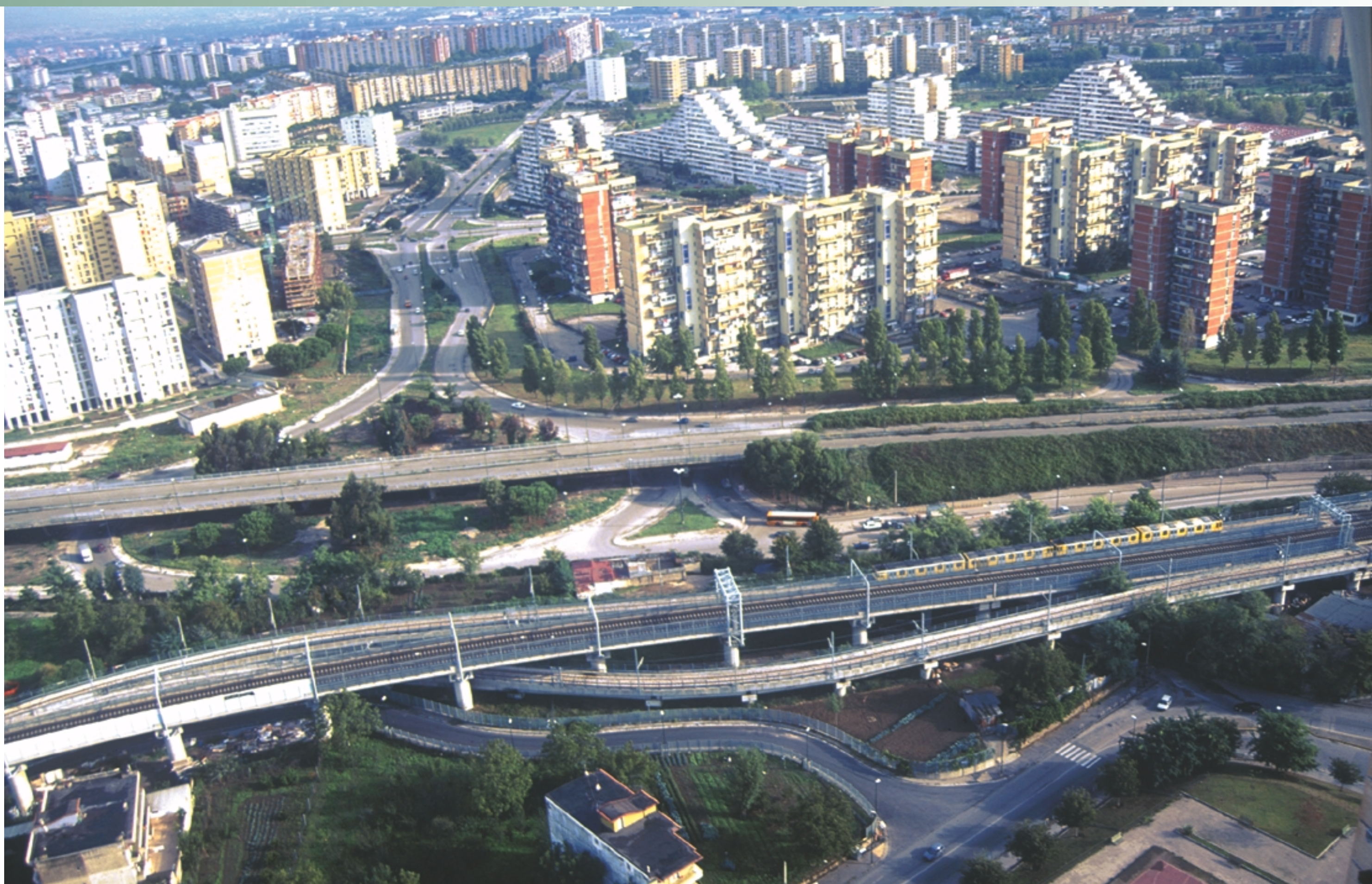
▲ Veduta aerea di Scampia

Nuovi edifici residenziali, realizzati con il programma di riqualificazione, in via Monte Rosa, sopra, e a via Ghisleri, sotto ▶