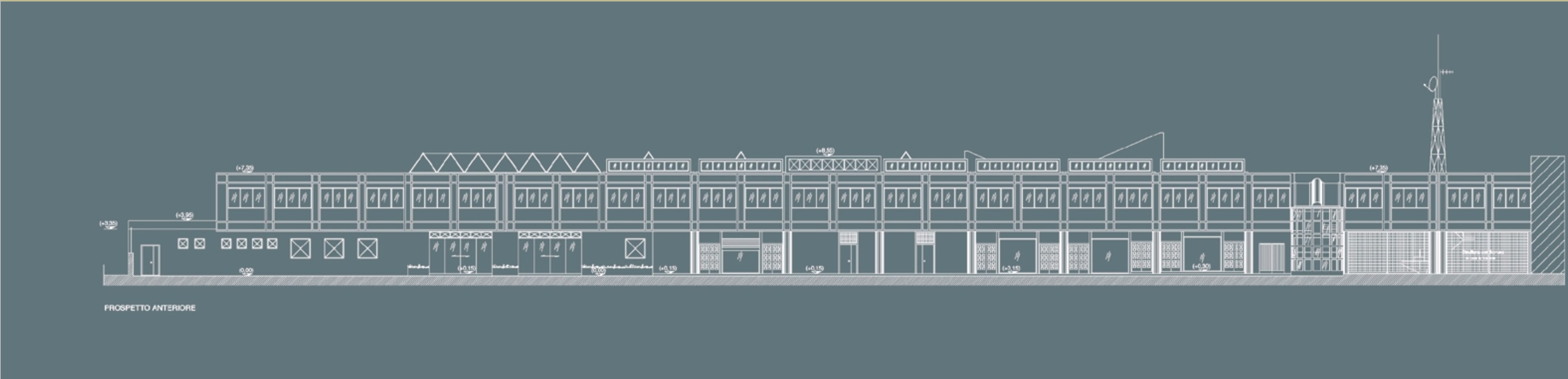
▼ Prospetto dell'edificio ristrutturato e destinato a piazza telematica

Nuovi edifici residenziali, realizzati con il programma di riqualificazione, in via Monte Rosa, sopra, e a via Ghisleri, sotto ▶