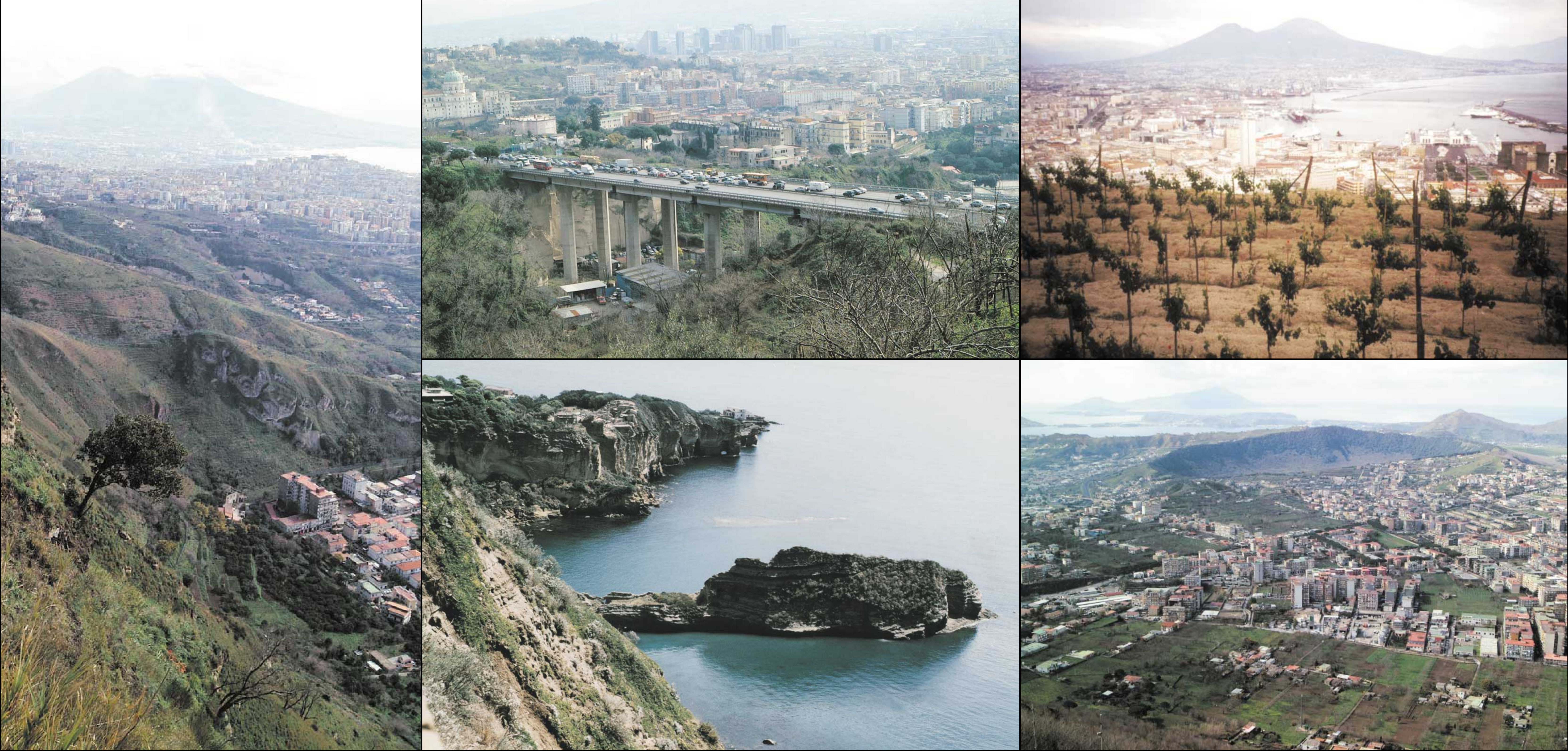
Da sinistra: pendici dei Camaldoli verso Soccavo; terrazzamenti dello Scudillo, sullo sfondo la zona orientale della città; la vigna a San Martino. Sotto: dal promontorio di Posillipo, vista del parco archeologico delle ville imperiali; panorama dei Campi flegrei dai Camaldoli, in primo piano la conca degli Astroni.

terreni agricoli, procurando ai coltivatori un reddito integrativo. La finalità fondamentale della proposta per la formazione di un sistema di aree verdi fa leva sulla riscoperta dell'identità naturale della città. Gli studi storici testimoniano l'ampiezza della campagna napoletana alla vigilia della moderna espansione edilizia, indagini sulla naturalità e la vegetazione documentano quanto queste risorse siano tuttora presenti nell'area urbana. E' quindi possibile perseguire l'obiettivo della convivenza fra città e natura, che peraltro è anche condizione di un qualificato sviluppo economico.